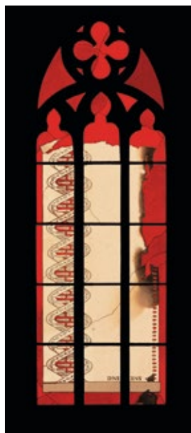
Fazit 72/1983/F II, Entwurf zum Heidelberger „Biologie-Fenster“

Der 95. Geburtstag des Künstlers und das 15-jährige Bestehen des Ausstellungsraums „Glas/Werke/Langen“ im Jahr 2025 sind Anlass genug, einerseits kritische Rückschau zu halten und zum anderen die Stiftung und ihre Arbeit der kunstinteressierten Öffentlichkeit mehr noch als bisher bekannt zu machen und das 25-jährige Jubiläum gemeinsam zu feiern.