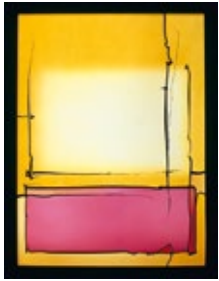
S.D.G. 17/1999/GB – „Mark Rothko gewidmet“